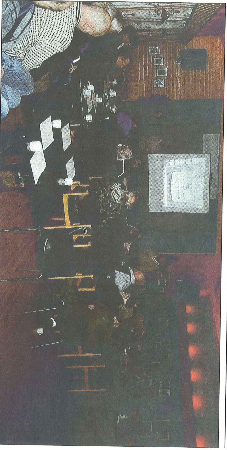
KRAFT ELLER IKKE: Mange i Signaldalen er spent på om det blir kraftutbygging eller om skogvern stopper planene. Her fra folkemøtet i mars der kommunen og Statskog deltok.